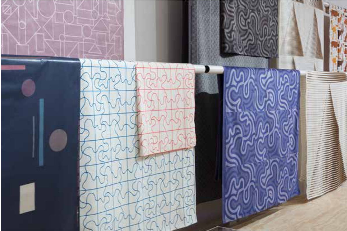
Verner Pantone: Kollektionen der 1980er-Jahre