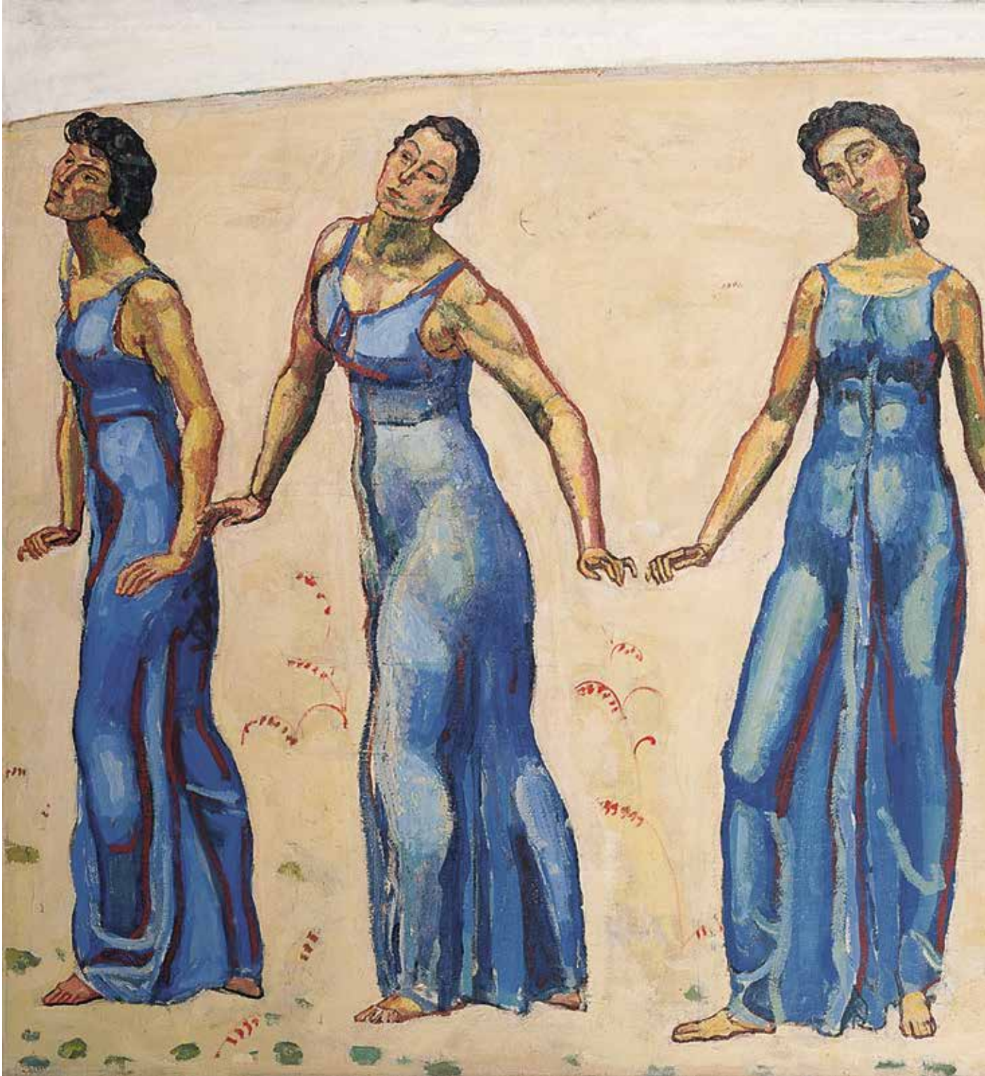
Ferdinand Hodler, Blick ins Unendliche , 1913–1916, Öl auf Leinwand, 138 x 245 cm, Kunst Museum Winterthur,