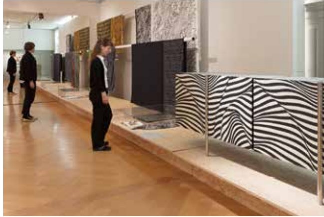
Trix & Robert Haussmann Sideboard Stripes