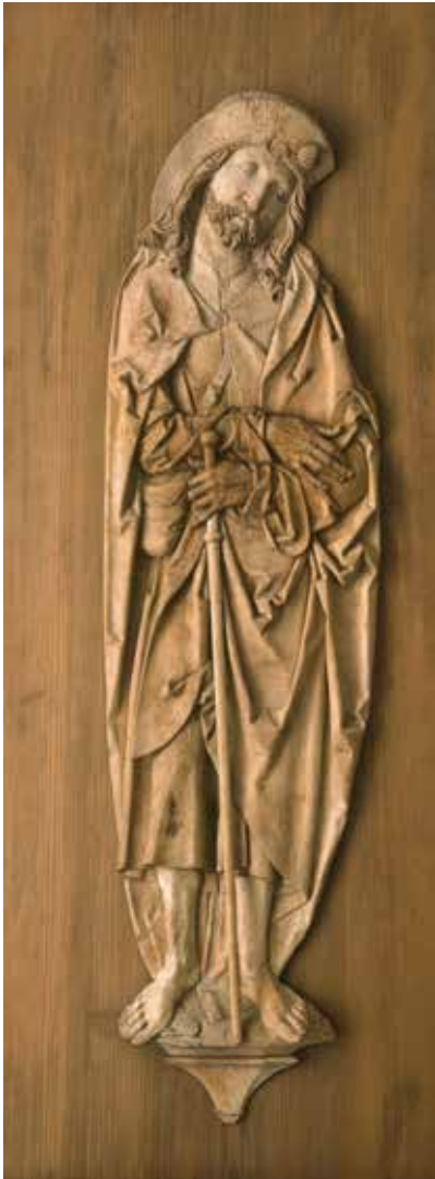
Jakobus der Ältere