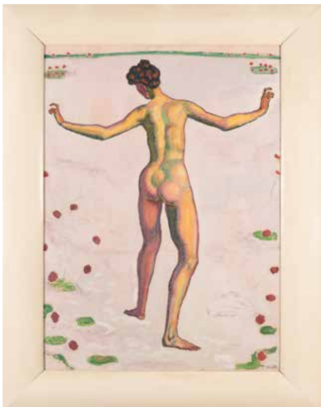
Ferdinand Hodler, Linienherrlichkeit, um 1909 Öl auf Leinwand, 121,5 x 88,5 cm, Kunstmuseum St. Gallen