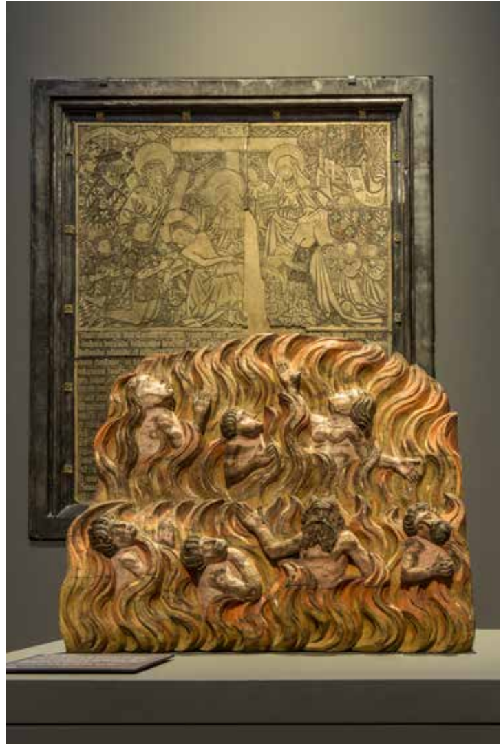
Glaubenswelten des Mittelalters