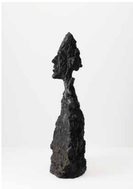
Alberto Giacometti, Buste de Diego, 1955 Bronze, 56,5 x 31,5 x 15 cm, Kunst Museum Winterthur Depositum der Alberto Giacometti-Stiftung, 1976

Das Kunst Museum Winterthur vereint erstmals überhaupt die beiden Grossen der Schweizer Kunst des 20. Jahrhunderts in einer Ausstellung: Ferdinand Hodler und Alberto Giacometti. Der Maler des Symbolismus der Jahrhundertwende trifft auf den Künstler des Existentialismus der Nachkriegsjahre. Die Ausstellung beschreitet entschieden neue Wege, indem es Hodler zu seinem 100. Todestag nicht mehr als Nationalmaler präsentiert, sondern in der Gegenüberstellung mit Giacometti neue gedankliche und ästhetische Zugänge eröffnet.