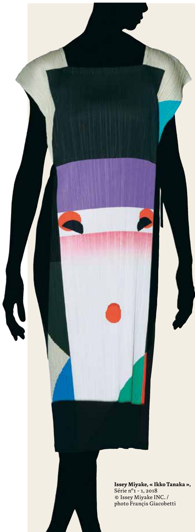
Issey Miyake, « Ikko Tanaka » , Série n°1 - 1, 2018 © Issey Miyake INC. / photo Francis Giacobetti