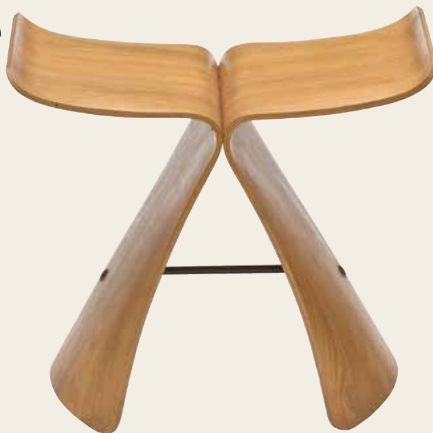
Sori Yanagi, « Butterfly stool » Tabouret, Japon, Fabriqué par Tendo Mokko Tokyo, Édition Steph Simon, 1956, Musée des Arts Décoratifs