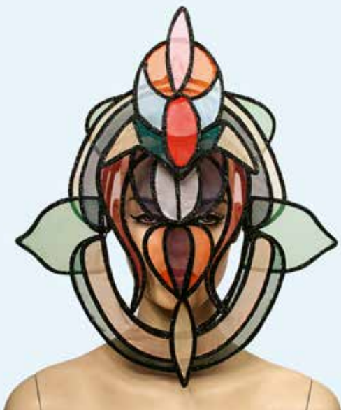
Stained Glass Mask, Kollektion Illuminated Hutmacherei: J. Smith Esquire Ltd., England