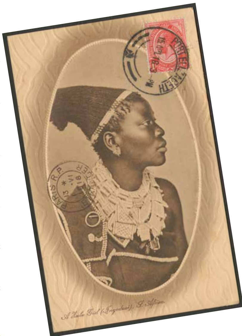
Carte postale représentant une femme zoulou d'Afrique du Sud Photographe inconnu, 1918. © Musée Rietberg.

En bois, fibres végétales, textile, cuir, coquillages (cypraea ou «porcelaine») et perles de verre; artiste originaire de la région des Bushongs, Kubas, République démocratique du Congo, vers 1900. Objet recueilli in situ vers 1938/39 par Hans Himmelheber. © Musée Rietberg, cadeau de Barbara et Eberhard Fischer.