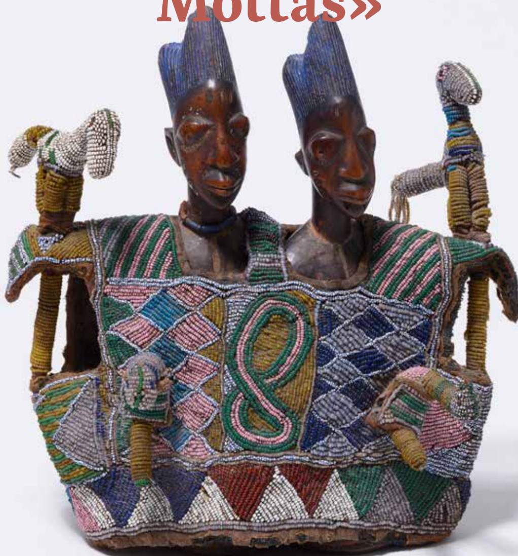
Statuettes de jumeaux en manteau de perles, ere ibedji

Artiste yorouba de la région de Oyo, Igbuke, Nigéria, 1900–1960. Bois et perles de verre, 29 x 35,5 x 18,5 cm.