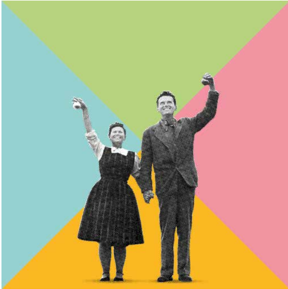
Charles und Ray Eames © Eames Office LLC, Fotomontage: Boros, Berlin

Die Ausstellung im Hauptgebäude des Vitra Design Museums gibt eine umfassende Übersicht über das Gesamtwerk und das Leben des Designerpaares. Mit einer grossen Auswahl von Originalwerken – darunter Filme, Fotografien, Möbel, Zeichnungen, Skulpturen, Malerei, Textilien, Grafikdesign, Modelle und Requisiten – veranschaulicht die Retrospektive das kongeniale Zusammenspiel der Charaktere von Charles und Ray Eames, das die Grundlage für das kreative Schaffen des wohl erfolgreichsten Designerduos der Geschichte bildete.