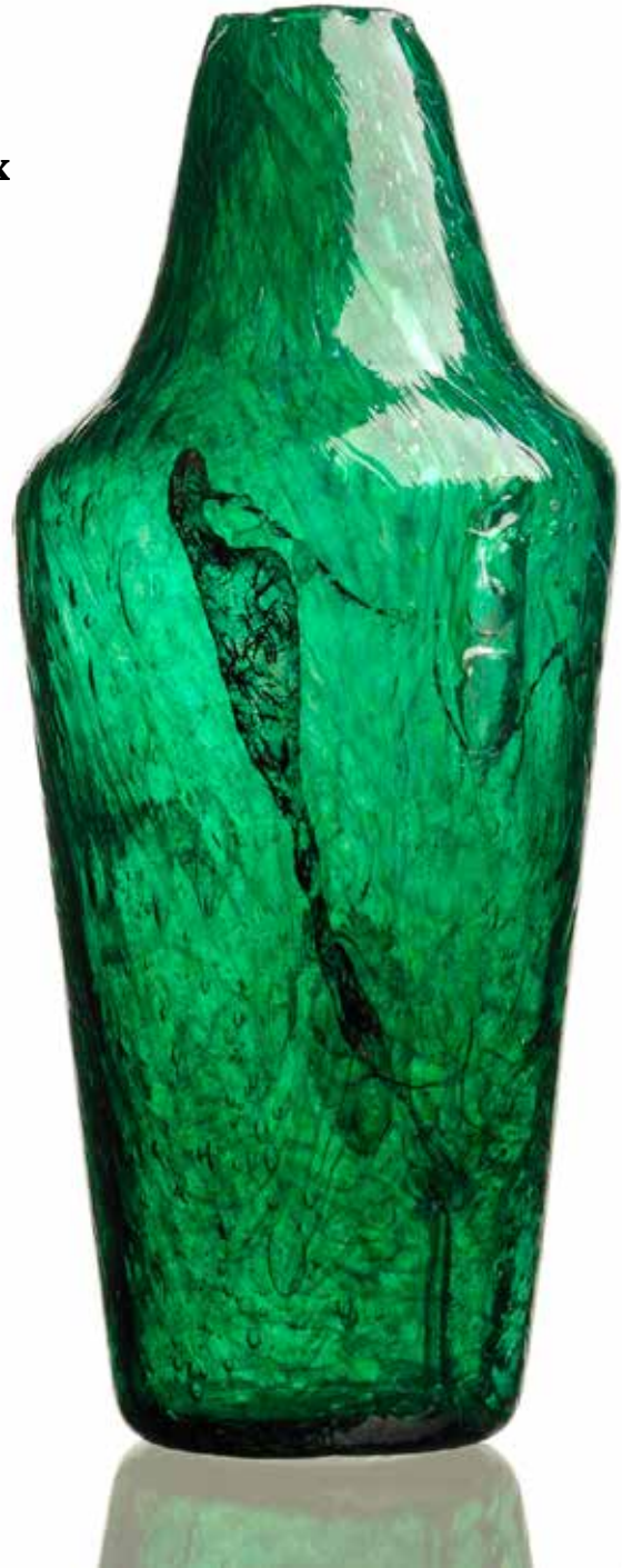
Blow Bangles, Ensemble de 404 empreintes en verre soufflé, vue d'atelier

Pendant deux années consécutives, l'artiste a fait l'expérience du territoire verrier de Firozabad, l'a photographié, l'a filmé et a réalisé l'inventaire de toute une production qu'il a ensuite délocalisée en l'exportant à Meisenthal au Centre International d'Art Verrier (CIAV). Une collection de 404 toras – bouquets de bangles entremêlés – a alors été soufflée dans des moules sauvegardés par le CIAV après les fermetures successives de nombreuses verreries lorraines. De là est née l'installation Blow Bangles composée de 404 « empreintes » de verre soufflées à la bouche par les artisans verriers de Meisenthal. Au mudac, l'ensemble des « empreintes » sont disposées sur un socle autour duquel le visiteur est amené à déambuler pour ensuite entrer dans une salle noire où le film Firozabad est projeté. Une troisième salle permettra au visiteur de retracer le processus créatif de l'artiste, au moyen de croquis et des premiers essais sculpturaux, en regard