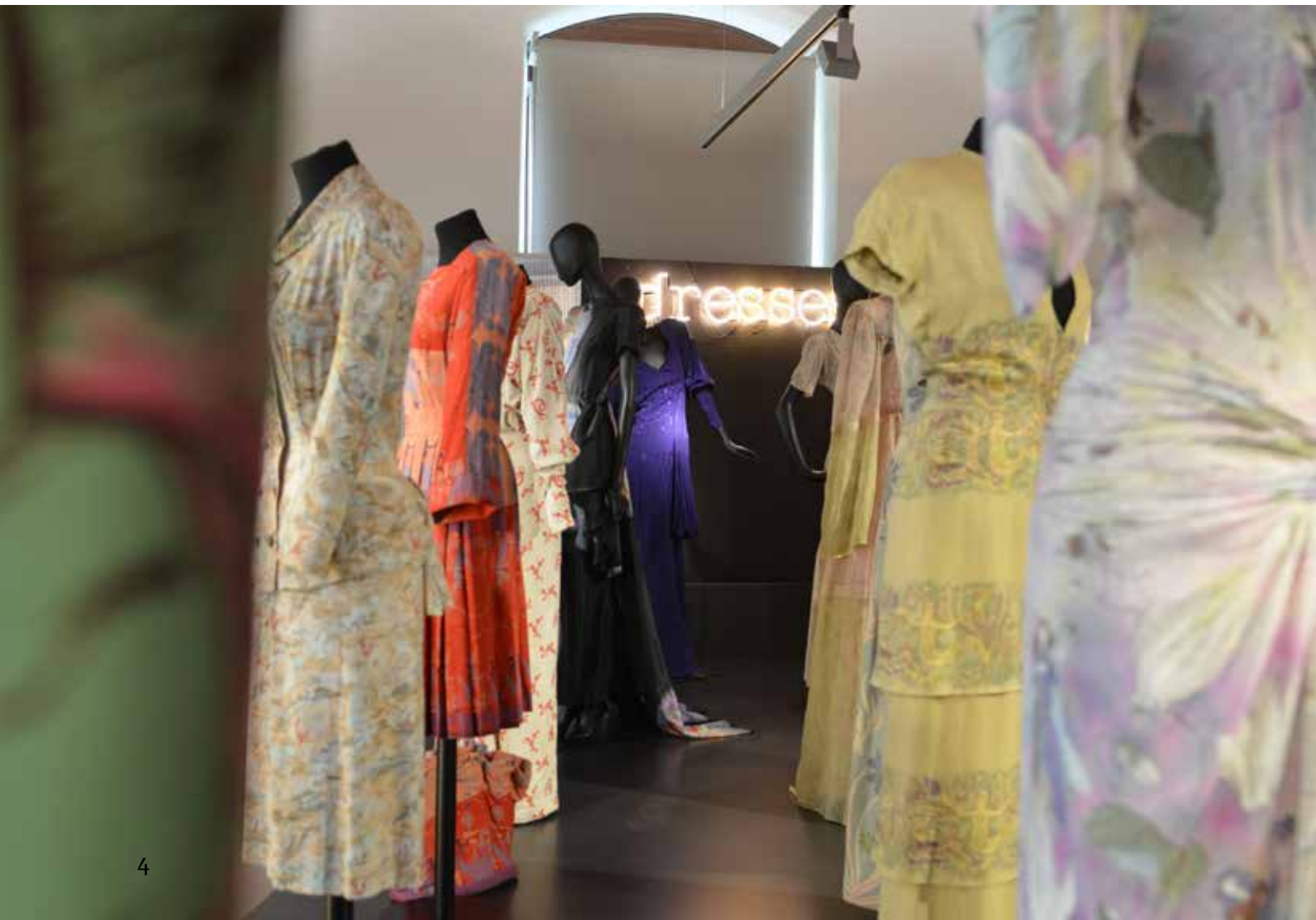
Blick in die Ausstellung

Das HVM sammelt auch Mode? Die meisten Historischen Museen zählen zu ihren Beständen auch Kleider und Trachten. Die Stadt St.Gallen, die sich seit dem