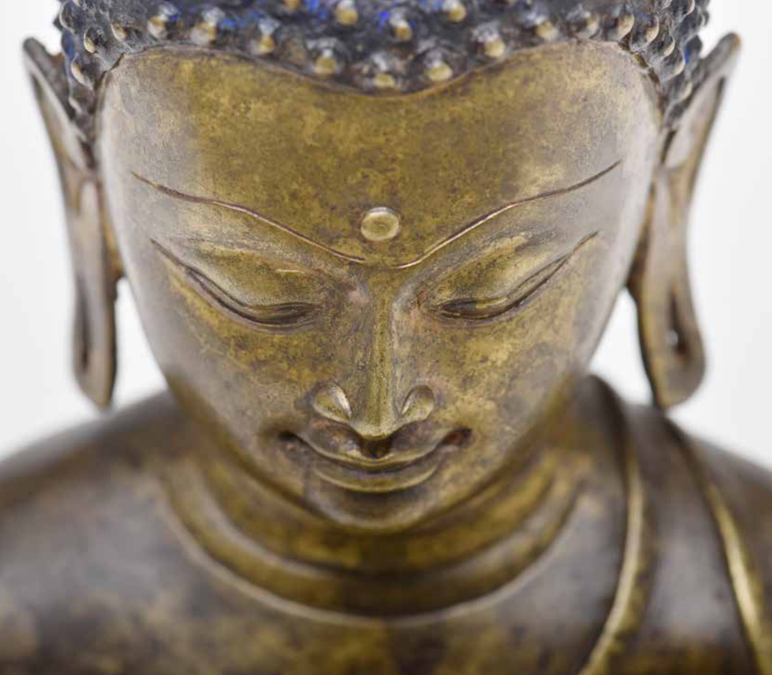
Buddha Shakyamuni (Detail)

Westliches Tibet, 12./13. Jahrhundert, Messinglegierung