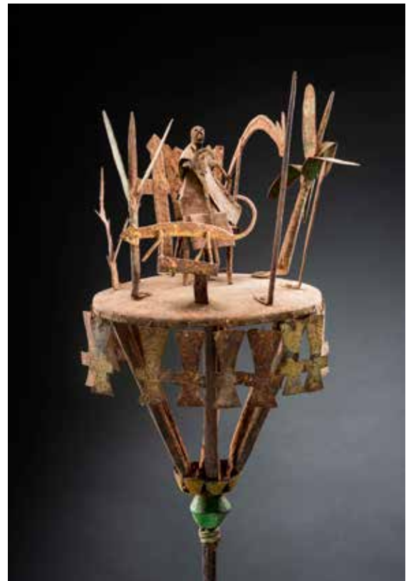
Asen du Maître de la plante gargantuesque

Dans la tradition régionale, les asen étaient également étroitement associés aux rites de guérison, de protection et de divination, ainsi qu'à la transmission du savoir entre le monde des esprits et le monde terrestre – dans les temples vodun, entre autres contextes. À mesure que la cour du Danhomè étendit son pouvoir, du XVII e au XIX e siècle, cette fonction fut progressivement délaissée au profit d'un usage plus