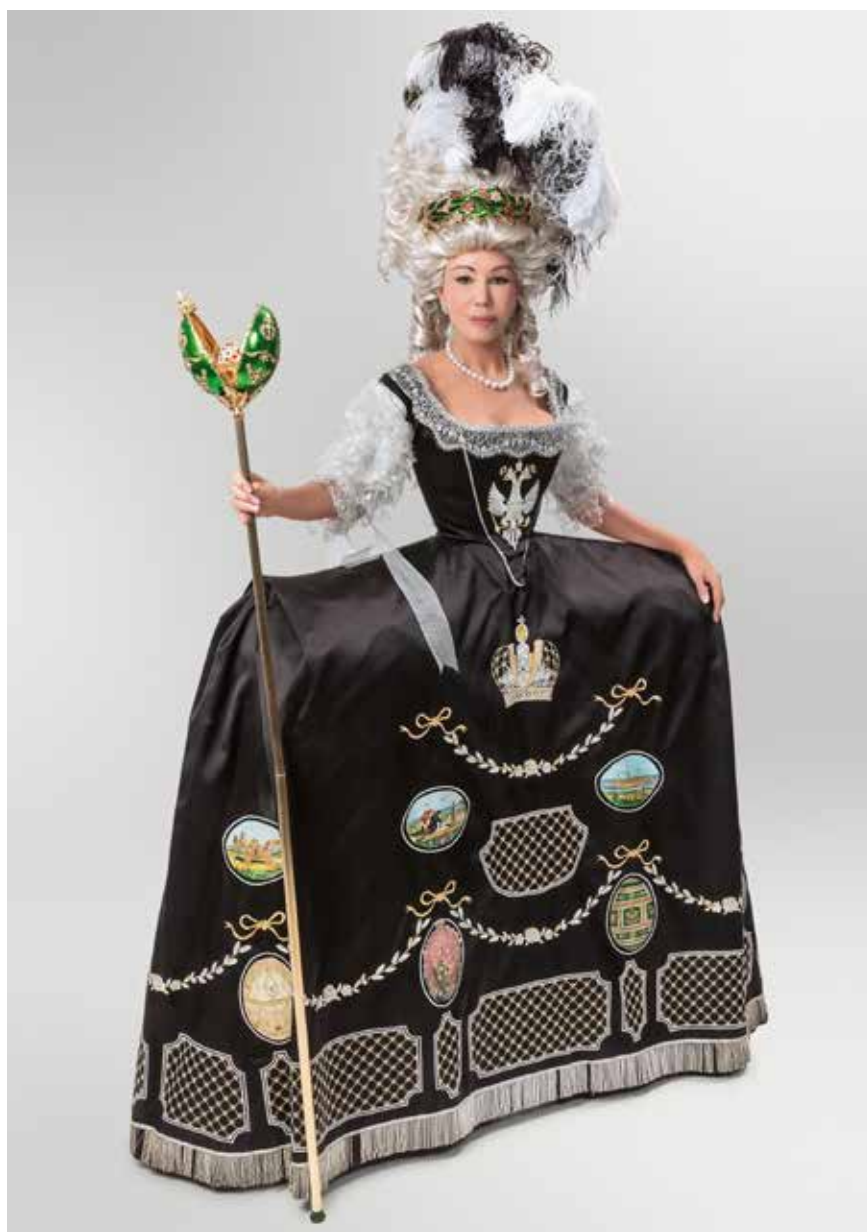
Robe de Pâques pour une tsarine ou l'hommage à Fabergé Costume: Jean Pierre Martinez, Maison Martin d'Autry Sceptre avec œuf: Michel Carel France, 2013

Des pièces uniques contemporaines richement ornées selon des modèles de jadis