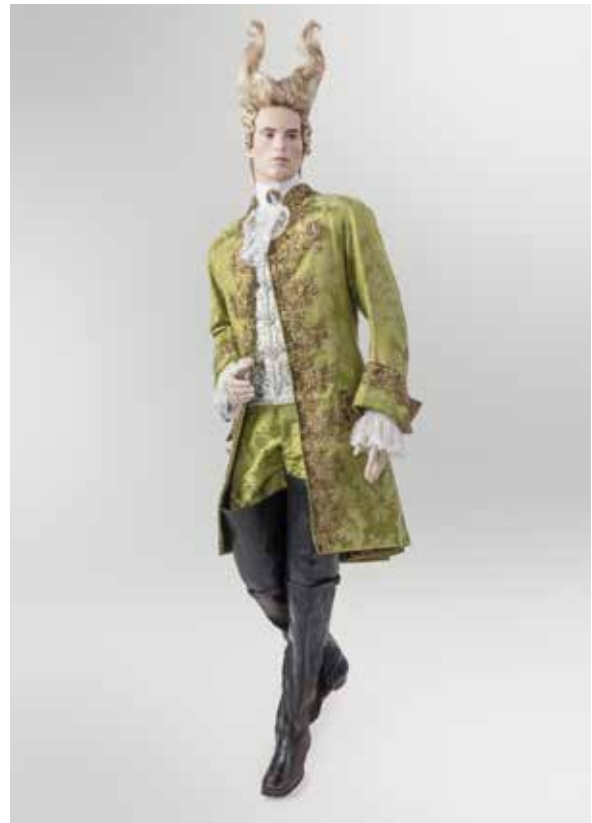
Le gentilhomme en vert, style 18 e – Ode à la Musique Costume: Jean Pierre Martinez, Maison Martin d'Autry France, 1993