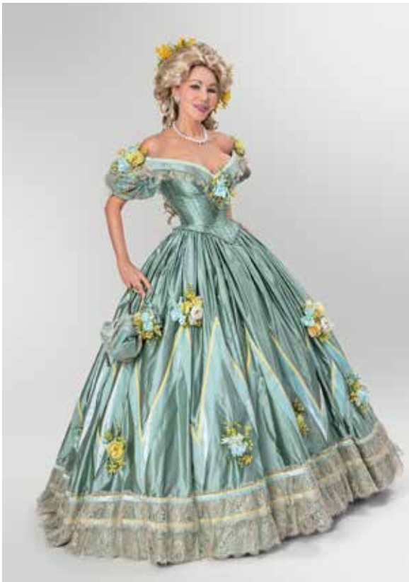
Second Empire, la dame aux mimosas Costume: Atelier Jacky Blanchard France, 2012

Les costumes de l'exposition temporaire sont issus d'une collection privée ; ils furent fabriqués sur mesure par les meilleurs artisans d'art de leur corporation. Il faut citer les costumes exquis de Jacky Blanchard, les ombrelles et les parapluies merveilleux du Maître d'Art Michel Heurtault, ainsi que les éventails magnifiques de Sylvain Le Guen. Toutes les matières premières, ainsi que les travaux sont originaires de France ou respectivement d'Europe. Certaines techniques pratiquement oubliées furent réactivées, d'autres savoir-faire ont malheureusement disparus depuis avec leur Maître d'Art.