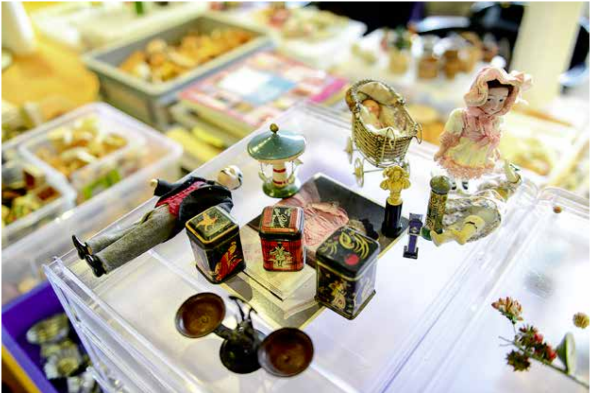
Einrichtungsgegenstände für Kaufläden, aus der Sammlung Frieda Wick-Willi

Seit Generationen vergnügen sich Kinder beim «Verkäuferlspielen». Die Ernst-Hohl-Kulturstiftung im Haus Appenzell zeigt im Rahmen der Ausstellung «Grosse Welt ganz klein – Verkaufslädli & Miniaturen aus West und Ost» rund 80 historische Kaufläden von der Biedermeierzeit bis zur Jahrhundertwende sowie die in der Schweiz kaum bekannten «Hairy Monkey»-Miniaturen aus China.